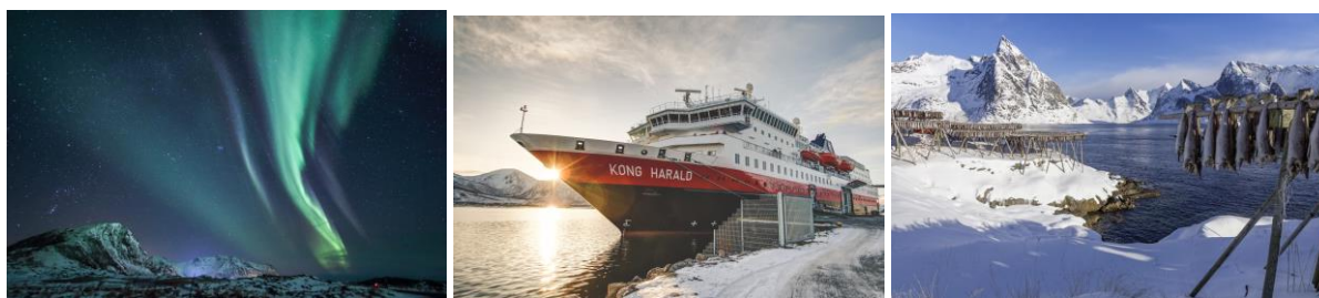
Bild von links nach rechts: Nordlicht, Jan Gelpke / Hurtigruten, Jan Gelpke / Lofoten, Shutterstock Cardaf

Um 09:00 Uhr erreichen Sie Kirkenes , die Endstation Ihrer Hurtigruten Reisen. In Kirkenes treffen Sie auf zweisprachige Strassenschilder, die auf die Nähe zur russischen Grenze aufmerksam machen. Anschliessend verzaubern die märchenhafte Schneelandschaft und die unglaubliche Weite. Auf der Fahrt nach Finnisch Lappland ist es möglich wilde Rentierfamilien bei der Futtersuche zu sehen. Am frühen Abend stapfen Sie mit Schneeschuhen durch die verschneite Winterlandschaft auf der Suche nach den kontrastreichen Nordlichtern inkl. einem traditionellen Abendessen in einer typisch Finnischen Kota . (F,A)